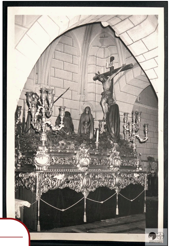
El paso dentro de Santiago (hacia 1960).