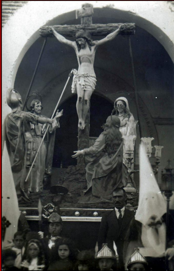
Antiguo paso a su salida de Santiago (hacia 1929)

Hermanidad del Santísimo Cristo de la Caridad Parroquia de Santiago Apóstol Ciudad Real