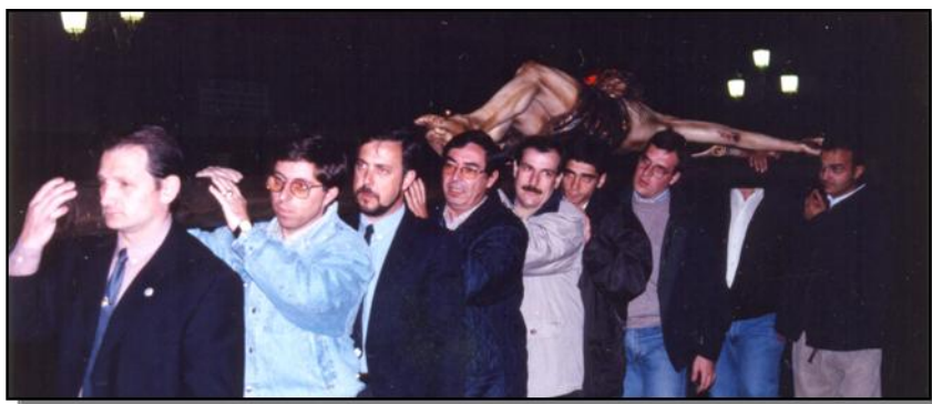
Vía Crucis de penitencia, Lunes Santo 1998