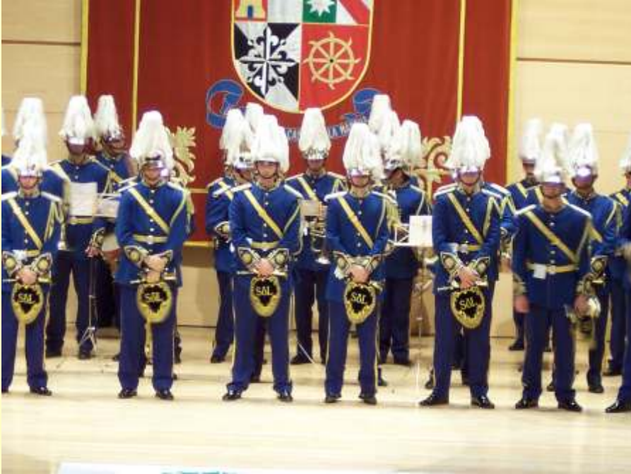
Concierto Benéfico: Ntra. Sra. Del Sol y Ntra. Sra. del Prado