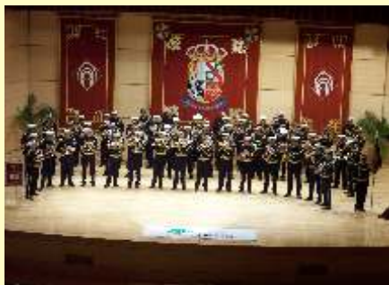
Banda de Cornetas y Tambores Ntra. Sra del Prado Ciudad Real

Anteriormente al concierto ambas bandas realizaron un pasacalles que se inició en la Iglesia de San Pedro y terminó en el Paraninfo de la UCLM, lugar donde se realizaba el acto. En el transcurso del mismo los espectadores pudieron escuchar marchas de ordinario como Sones de Sol, Plumas por Sevilla y el último éxito televisivo, Pasión de Gavilanes, interpretadas magníficamente por la Banda del Sol de Sevilla.