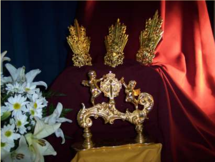
Detalle: Llamador y potencias