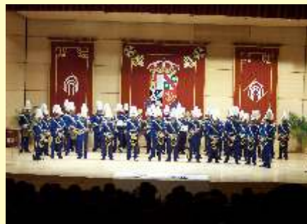
Banda de Cornetas y Tambores Ntra. Sra del Sol Sevilla