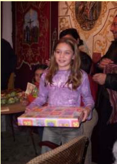
Concurso de Christma