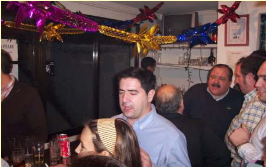
Comida Navidad con la Hermandad de las Penas