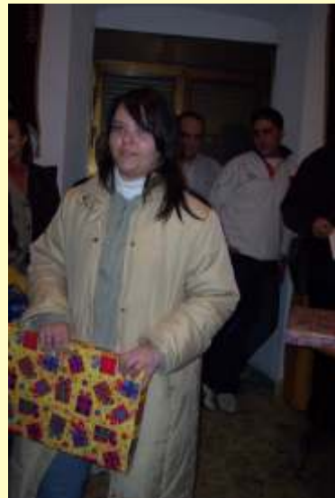
Ganadora concurso de christma